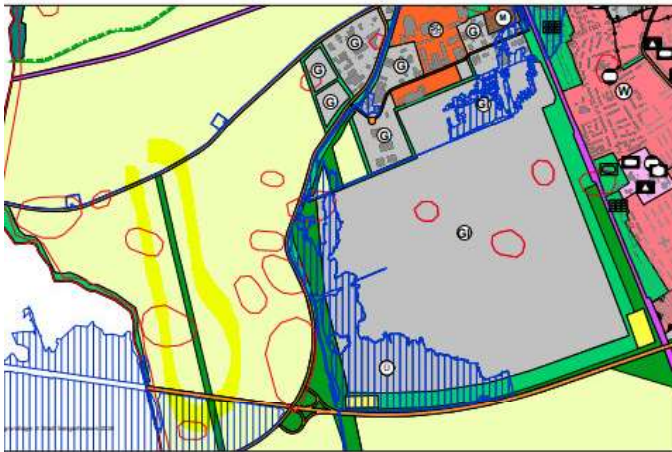
Zeichenerklärung für den bestehenden Flächennutzungsplan

Die Ausweisung der Flurstücke (172 und 174, Flur 19) als Grünfläche wurde im Flächennutzungsplan Stand 2018 noch korrekt ausgewiesen. In der Planzeichnung zur 7. Änderung des Flächennutzungsplans der Stadt Sangerhausen fällt die Ausweisung der Grünfläche weg.