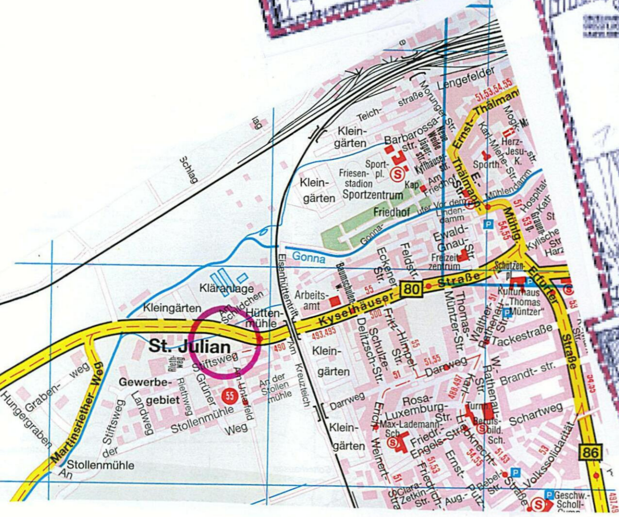
Geltungsbereich 8. Änderung B-Plan Nr. 4 b